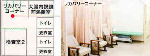
リハビリコーナー