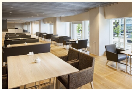
コアガリ（2階） カフェラウンジ