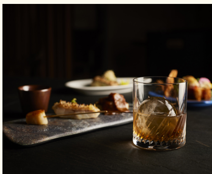
シュン（6階） ワイン&ダイニング ※定休日：月・火