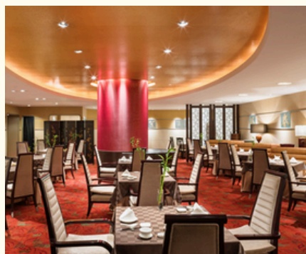
エンプレスルーム（10階） 中国料理

また、上記店舗利用に加えてルームサービスとして、和洋中をはじめとしたアラカルトメニューもご利用いただけます。