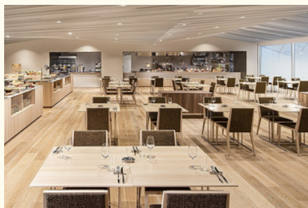
ユラユラ（2階） レストラン