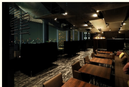
雲雲（20階） バーラウンジ

また、上記店舗利用に加えてルームサービスとしてお飲み物から軽食もご利用いただけます。